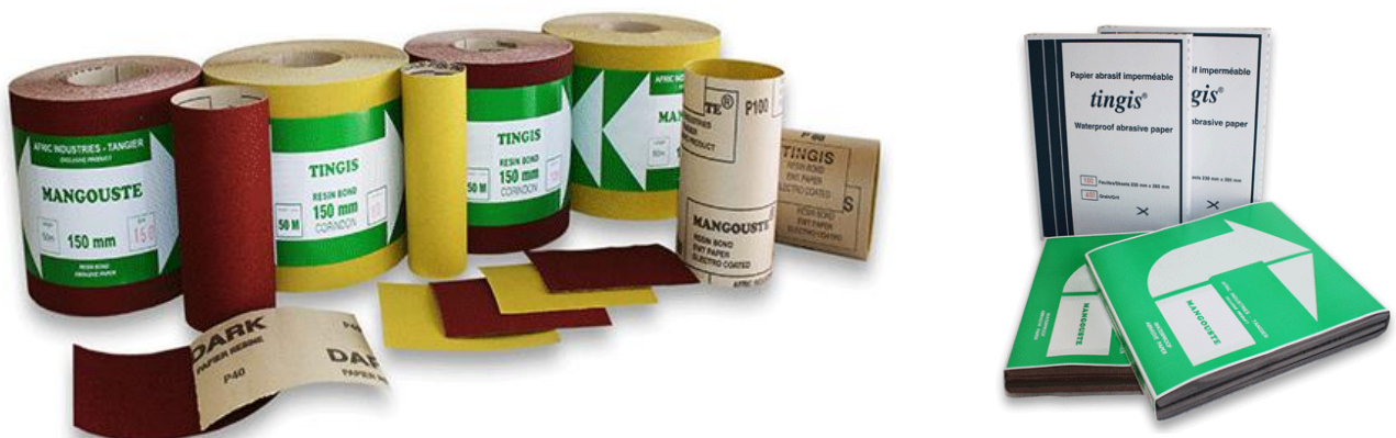
FIGURE 1 : PRODUITS ABRASIFS COMMERCIALISÉS PAR AFRIC INDUSTRIES S.A.